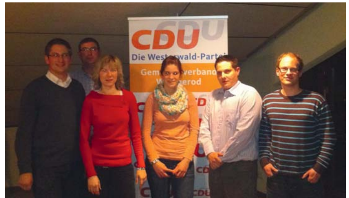
Junge Union Gemeindeverband Wallmerod